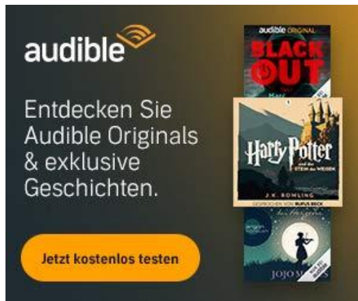
Banner Medium Rectangle

Banner werden auf allen Seiten im Tonspion ausgespielt, sodass 100% unserer Leser mit deiner Botschaft erreicht werden. Wir bieten responsive Standardformate, die auf alle Geräten funktionieren. Sonderformate nach Vereinbarung und gegen Aufpreis möglich.